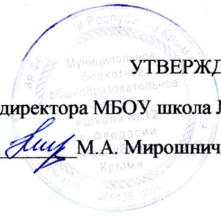
График мероприятий ВСОКО